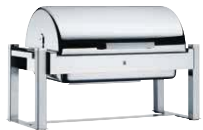
WMF CHANGE, rund oder im GN-Format. WMF CHANGE, round or in GN format.

Although there is a big range, all WMF chafing dishes have one thing in common: They are both attractive and functional. And really easy to use. From simple one-handed operation of the lid to the condensation return system. In various sizes and designs, with comprehensive accessories for flexible use at the buffet.