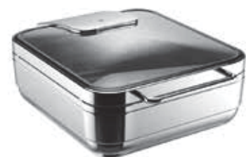
WMF HOT & FRESH, induktionsgeeignet. WMF HOT & FRESH, suitable for induction use.